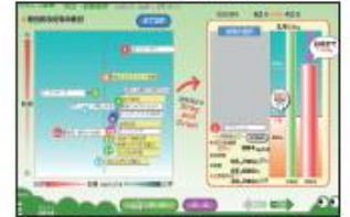
効果的な対策のご提案